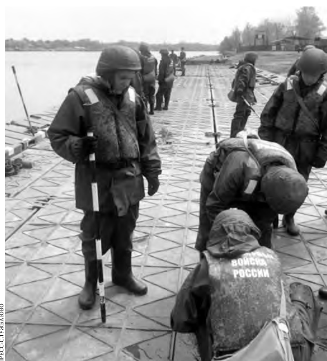
Понтонный мост выдержит и грузовики, и пассажирские автобусы.