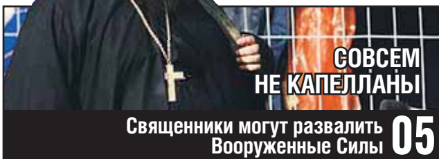
СОВСЕМ НЕ КАПЕЛЛАНЫ

Священники могут развалить Вооруженные Силы 05