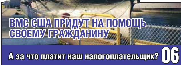
ВМС США ПРИДУТ НА ПОМОЩЬ СВОЕМУ ГРАЖДАНИНУ

Священники могут развалить Вооруженные Силы 05