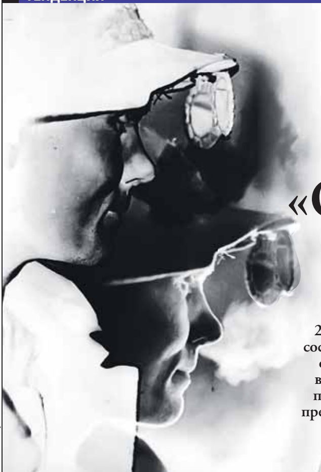
Коллаж Андрей СЕДИХ