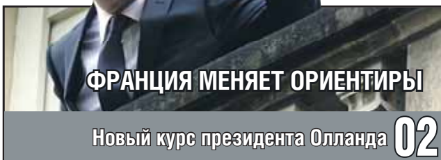
ФРАНЦИЯ МЕНЯЕТ ОРИЕНТИРЫ