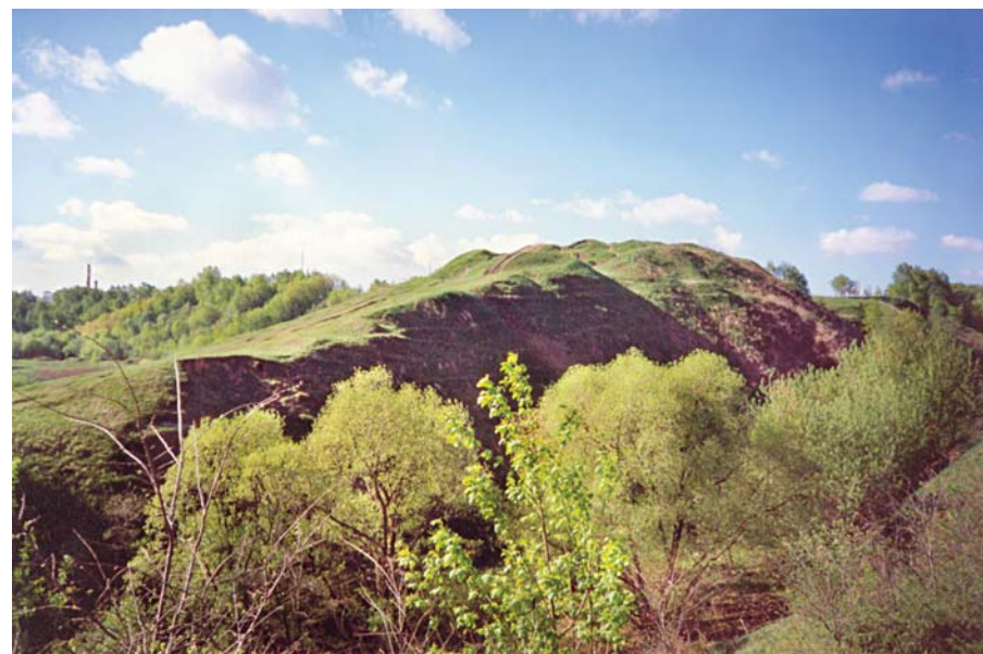
Дьяково городище (IV тысячелетие до н.э. — IV в. н.э.). Древнейшее поселение людей на территории Москвы

Интенсивная хозяйственная жизнь приводит к усилению антропогенного пресса на окружающую природу. Племенами фатьяновской культуры было положено начало вырубке лесов и, соответственно, формирования лугов в Подмосковье, особенно в поймах рек и озер. Длительные выпасы свиней на одном месте приводили к полному уничтожению растительности. Вынужденные постоянные переходы поселенцев на новые места в поисках пастбищ приводили к вовлечению в хозяйственный оборот все новых и новых участков земли. Возобновление корен-