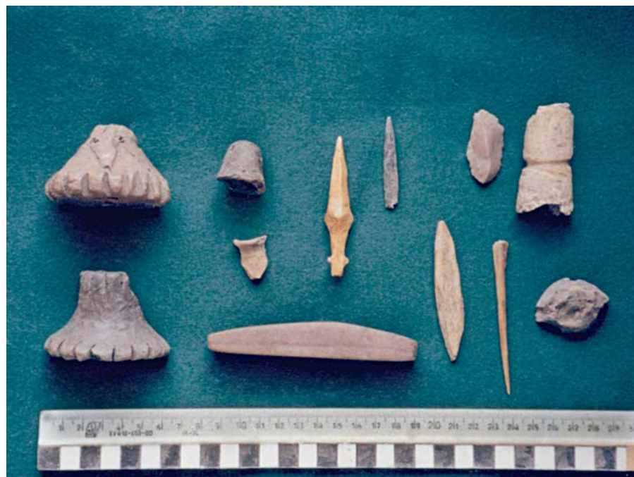
Находки предметов раннего железного века, найденные на Дунинском городище под Звенигородом (Московская обл.)

Примерно с VIII в. до н.э. в Подмосковье люди стали селиться на высоких берегах, выбирая труднодоступные участки: мысы и стрелки между берегами рек и впадающими в них крутосклонными балками