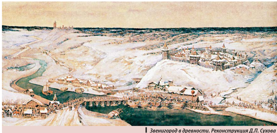
Звенигород в древности. Реконструкция Д.П. Сухова

Неолитическая революция, когда произошел переход от присваивающего к производящему типу хозяйства, как это ни странно, в Центральной России произошла только в бронзовом веке. Почему не раньше — до сих пор остается большой загадкой. Так вот, бронзовый век — переломный этап в развитии человеческого общества в Подмосковье. В начале второго тысячелетия до н.э. на территорию Московского края, когда там еще обитали неолитические племена, откуда-то с юго-запада пришли племена культуры боевых топоров, так называемой фатьяновской культуры. Приход фатьяновцев совпал, а может быть, и был обусловлен значительным потеплением и сухостью климата в это время. В Подмосковье возвращаются широколиственные леса с богатой ресурсной базой. Из-за засушливого климата снизился уровень воды в реках, соответственно стали доступными к освоению речные поймы.