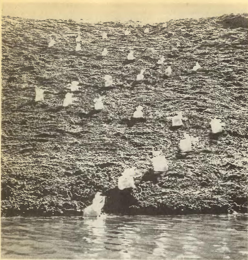
Ф. Инфанго. Мешочки. 1978 год.

ской проблемы, любой конкурс не столько объединит, сколько разъединит людей.