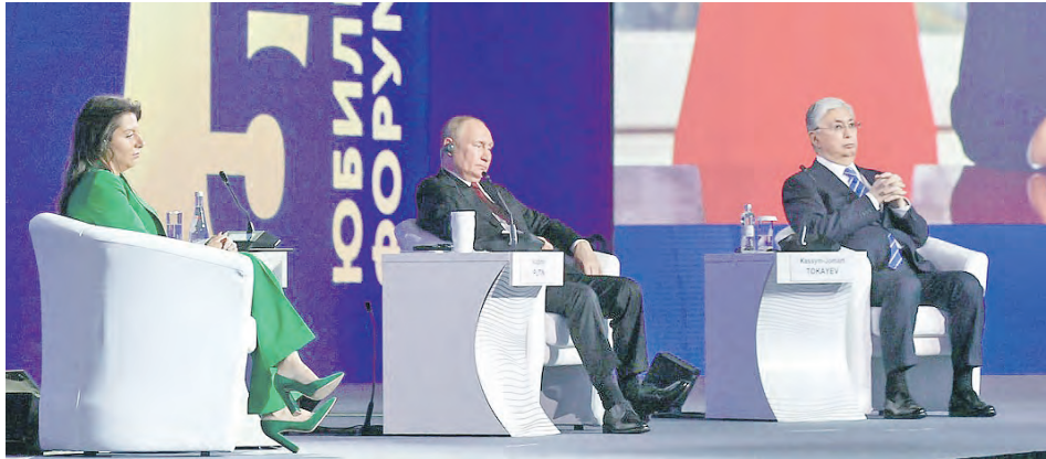
Президент России Владимир Путин ответил на все вопросы присутствующих

Как отметил Владимир Путин, форум проходил в непростое для мирового сообщества время, когда экономика, рынки, да и сами принципы глобальной экономической системы оказались под ударом ради амбиций известных стран и во имя сохранения устаревших геополитических иллюзий.