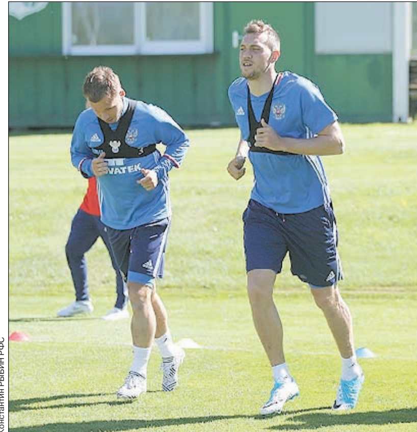
Вчера. Нойштифт. Роман ШИШКИН (слева) и Артем ДЗЮБА на тренировке сборной России.