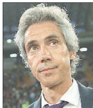
ПАУЛУ СОУЗА (Португалия)

Почему Акинфеев остался в Москве? Как самочувствие Дзюбы? Что с носом у Фернандеса? На главные вопросы в первый день сбора в Австрии отвечает главврач сборной России Эдуард БЕЗУГЛОВ.