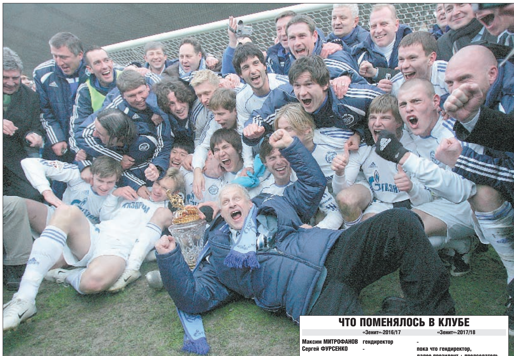
11 ноября 2007 года. Раменское. «Сатурн» - «Зенит» - 0:1. Сергей ФУРСЕНКО и футболисты питерского клуба празднуют свое первое чемпионство в российской истории.