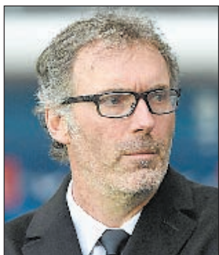
Лоран БЛАН (Франция)