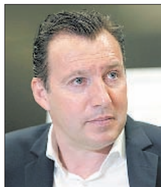
Марк ВИЛЬМОТС (Бельгия)