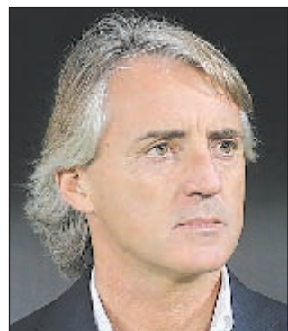
Роберто МАНЧИНИ (Италия)