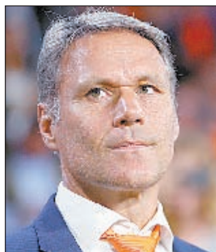
Марко ВАН БАСТЕН (Голландия)