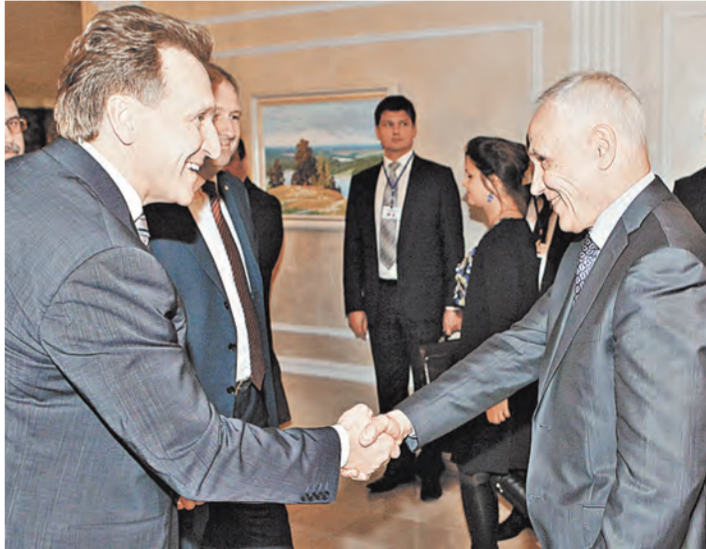
Первый заместитель Председателя Правительства России Игорь Шувалов и Государственный секретарь Союзного государства Григорий Рапота — члены Группы высокого уровня.

АНОНС / Репортер «СОЮЗа» попробовал себя в роли стажера проводника скорого поезда «Брест—Москва»