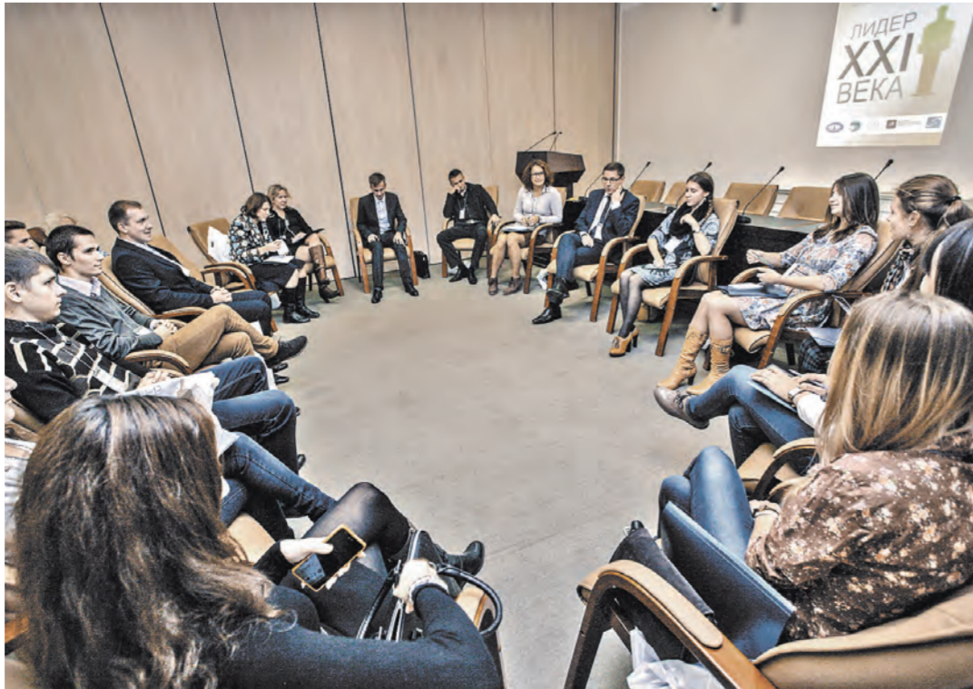
Международный форум «Лидер XXI века» прошел при поддержке МИД Беларуси, Департамента внешнеэкономических и международных связей Москвы и Россотрудничества.

проекта в голове дойти до проекта на бумаге, как найти средства. Дать возможность связывать контакты — без этого общественная