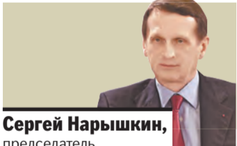
Сергей Нарышкин, председатель Парламентского Собрания Союза Беларуси и России:

— Успехи Союзного государства несомненны и представляют практический интерес как для России и Беларуси, так и для интеракционных объединений, в которых они участвуют, прежде всего для Евразийского экономического союза. Продолжающийся не первый год мировой финансовый кризис и усиливающаяся внешнее давление привели к изменению экономической реальности, в которой живут Россия и Беларусь. В этой связи Союзному государству необходимы новые решения в вопросах стратегического планирования и повышения эффективности бюджетных расходов.