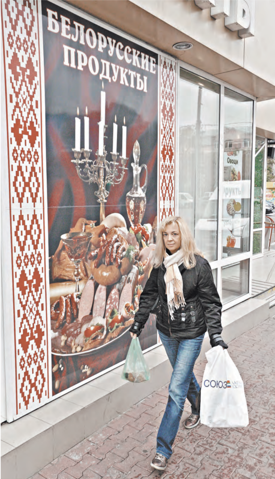
Наш обозреватель прямо с вокзала отправилась в магазин белорусских товаров, что на Дмитровском шоссе, и лично убедилась: продукты белорусских производителей в Москве есть. И пользуются у москвичей большим спросом.

тировой баланса поставки продовольствия на 2015 год в связи с российским эмбарго на ряд западных товаров. Он отметил, что после введения санкций Беларусь поставила в августе в Россию 5,3 тысячи тонн мяса птицы, что составило 115 процентов к аналогичному периоду прошлого года, 9 тысяч тонн масла (это уже составило 148 процентов) и 17,5 тысячи тонн сыров (к прошлому году 141 процент). «Мы имеем возможность нарастить поставки в Россию с учетом наших запасов и роста производства», — подчеркнул министр продовольствия Беларуси. — Уже сегодня ежедневно в Россию поставляется на 1600 тонн молока больше по сравнению с аналогичным периодом прошлого года. До конца года поставки молока в Россию могут быть увеличены в 1,4 раза.