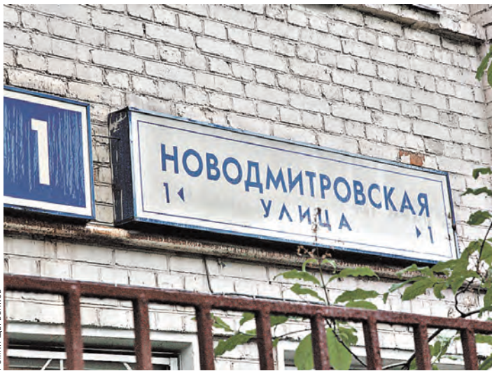
На нынешней Новодмитровской улице, которая раньше называлась Большой Панской, в середине XVII века жили белорусы.

АНОНС / В Татарстане открылся уникальный туристический маршрут На мельницу к Купале