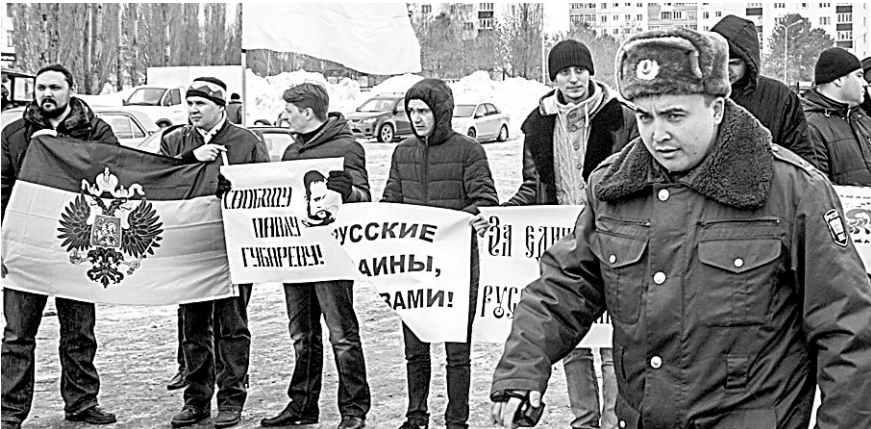
Многие жители региона готовы оказать Крыму поддержку, в том числе и материальную.