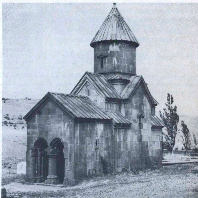
Церковь Арутюн в Цахкадзоре, Армения

ЕЖЕМЕСЯЧНЫЙ ОБЩЕСТВЕННО-ПОЛИТИЧЕСКИЙ ЖУРНАЛ