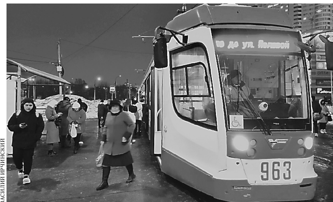
Изнешенный парк электротранспорта – еще одна проблема Самары.