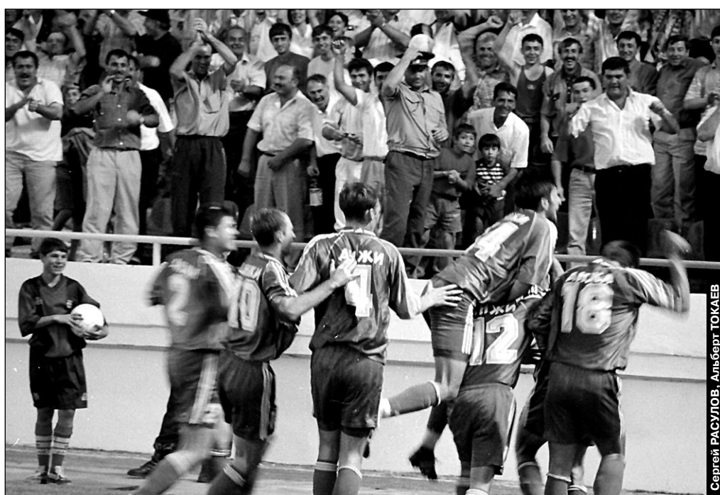
Суббота. Махачкала. Стадион «Динамо». «Анжи» - «Алания» - 2:0. Секретное оружие дерзкого дебютанта высшего дивизиона: 11 на поле плюс 13 000 на трибунах 12-тысячного стадиона - одна команда!

Кроме того, Махачкала, похоже, становится законодателем европейской моды в России по системе игры «в линию». 14 пропущенных мячей (третий результат в чемпионате) и мнение владикавказца Александра Аверьянова на этот счет (стр. 4) - тому подтверждение.