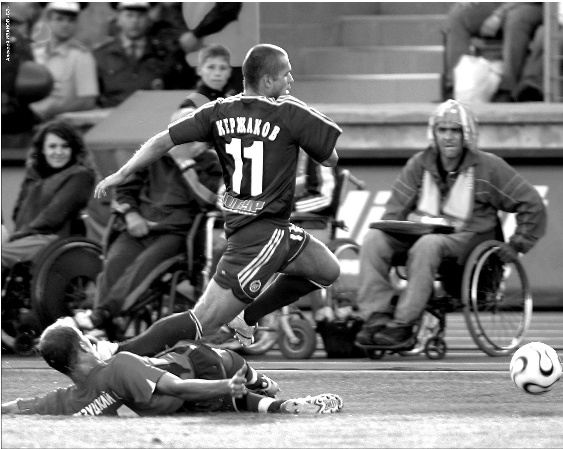
Вчера. Санкт-Петербург. Стадион «Петровский». «Зенит» — ЦСКА — 0:0. Александр КЕРЖАКОВ и Василий БЕРЕЗУЦКИЙ — два кандидата в сборную России.