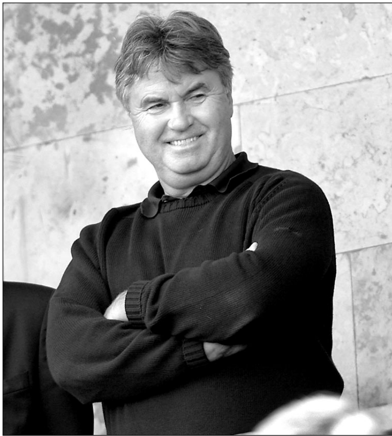
Судя по всему, вчерашним матчем Гус ХИДДИНК остался доволен.

— Отличия все-таки есть. Надо отдавать себе отчет, в какой стране мы находимся. Но думаю, если клубы и сборная будут способны проводить в высоком темпе все 90 минут и даже больше, то российский футбол поднимется. Впрочем, во второй половине второго тайма темп мне понравился. Возможно, в других матчах он будет выше и в течение всей игры.