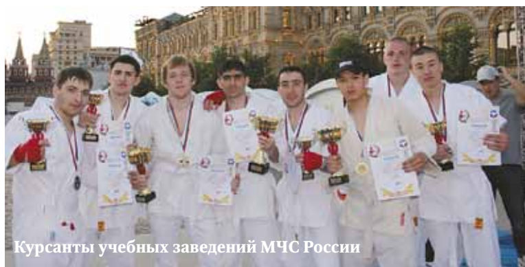
Курсанты учебных заведений МЧС России

Хякунин-кумитэ — «100 боев за один день» — испытание с непрерывно меняющимися каждые две минуты противниками. Прохождение теста в 100 боев считается высшим достижением в Киокусинкай.