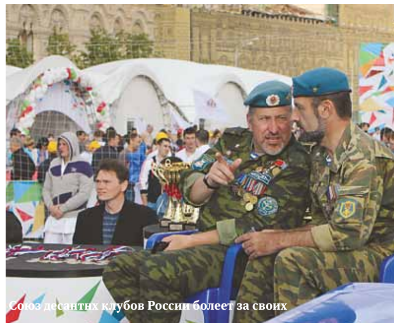
Союз десантных клубов России болеет за своих

Вале-тудо (порт. vale-tudo — рус. «всё дозволено») — бои без правил, полноконтактное безоружное боевое соревнование из Бразилии. В вале-тудо используются техники из многих стилей, таких как бразильское джиу-джитсу, муай тай, самбо, дзюдо, бокс и борьба.