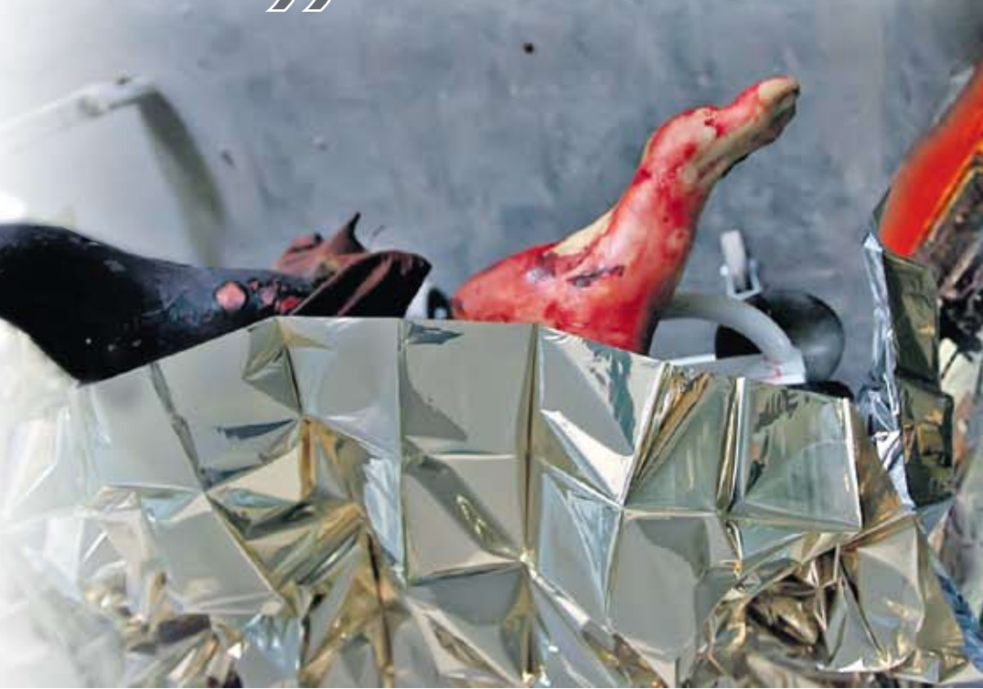
Коллаж Андрея СЕДЫХ

“ В итоге, если не будет найдено противоядие от превращения российского государственного бюджета в источник финансирования войны против самой же России, борьба может длиться бесконечно ”