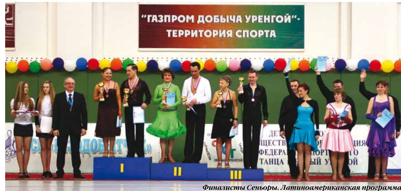
Финалисты Сеньоры. Латинская программа

шлом году некоторые из них приехали на турнир, но из-за стресса не стали соревноваться. Кстати, в Москве бывает на турнирах в этой категории иногда собирается не более 4 пар, а тут 6! В категории взрослые «хобби» класс тоже соревновался полный финал. Так что танцы в Новом Уренгое любят не только дети, но и взрослые!