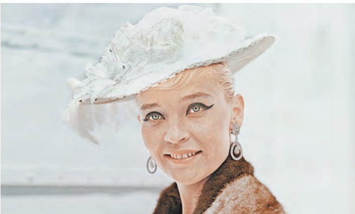
Светлана Светличная: «Бриллиантовая рука» не дала мне в профессии стать самой собой. От меня все ждали и хотели Анну Сергеевну. Я стала ее вечной заложницей...

Она не скрывает своего возраста: в свои 75 лет может и мини-юбку позволить. Отплывшая так, что у тридцатилетних брови домиком встают от удивления. Говорит непривычно откровенно, кокетливо. И романтично.