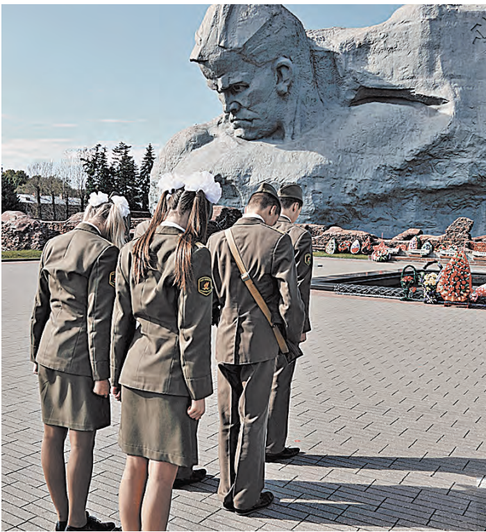
Наш священный долг — хранить память о подвиге героев и всеми силами отстаивать историческую правду.

С праздником Великой Победы вас, дорогие друзья!