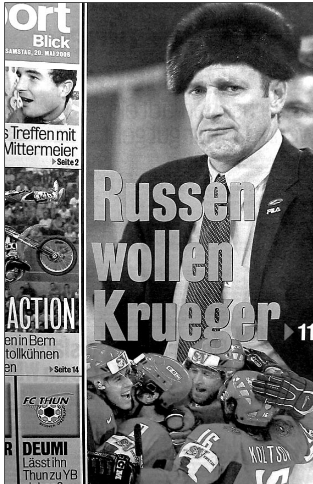
«Русские хотят Крюгера» - утверждает «шапка» спортивного приложения к швейцарской газете Blick.

Резюме швейцарских СМИ: «Говорят, за деньги в России сегодня можно купить все, но только не успех. И только не нашего любимца нации».