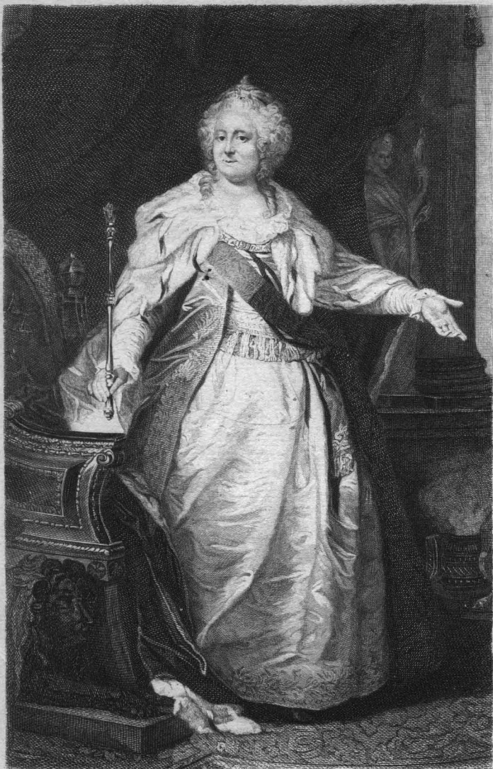
Грав. И. Ф. Дейнингеръ.