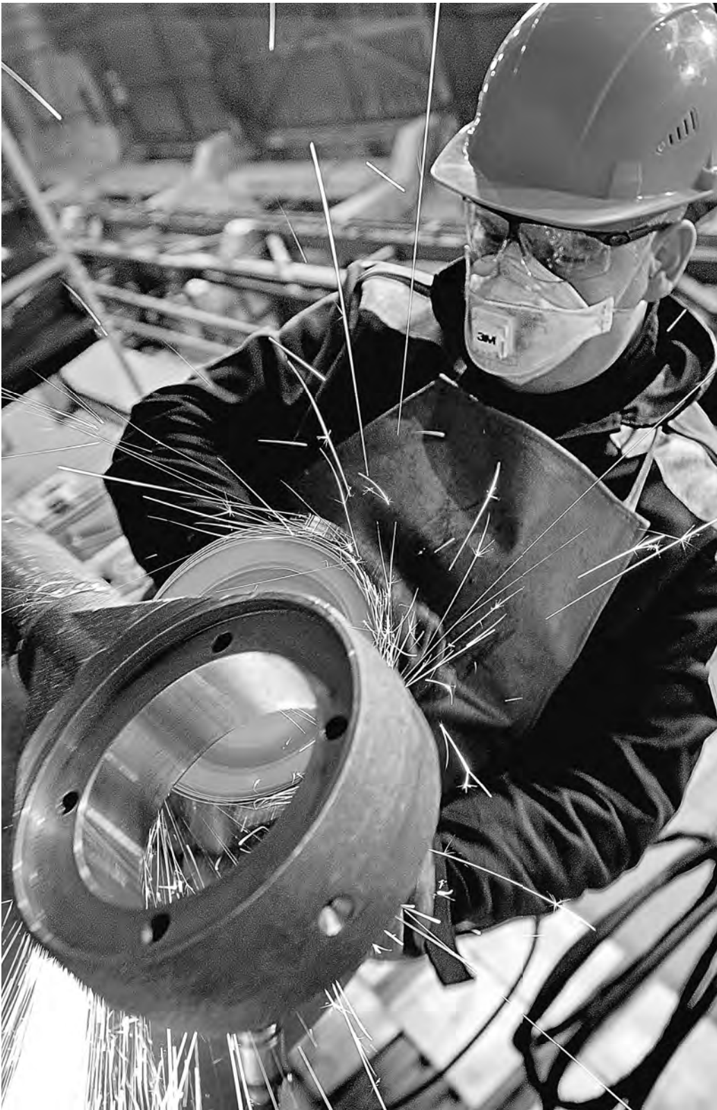
Западные санкции дают возможность отечественным предприятиям освоить производство товаров, которые выпускали иностранные компании.

Речь идет и о докапитализации региональных институтов поддержки МСБ, льготном кредитовании проектов в импортозамещении и единой госплатформе «бесшовного межрегионального взаимодействия». На основе этой платформы планируется по- ставить импортозамещающую продукцию и технологии в приоритетном порядке. Предлагается увеличить микрозаймы (до десяти миллионов рублей), ввести мораторий на проверки малого, среднего и крупного бизнеса, увеличить льготы для импортоза-