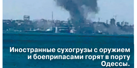
Иностранные сухогрузы с оружием и боеприпасами горят в порту Одессы.

Эксперт Дандыкин рассказал, зачем Россия уничтожила иностранные суда с оружием