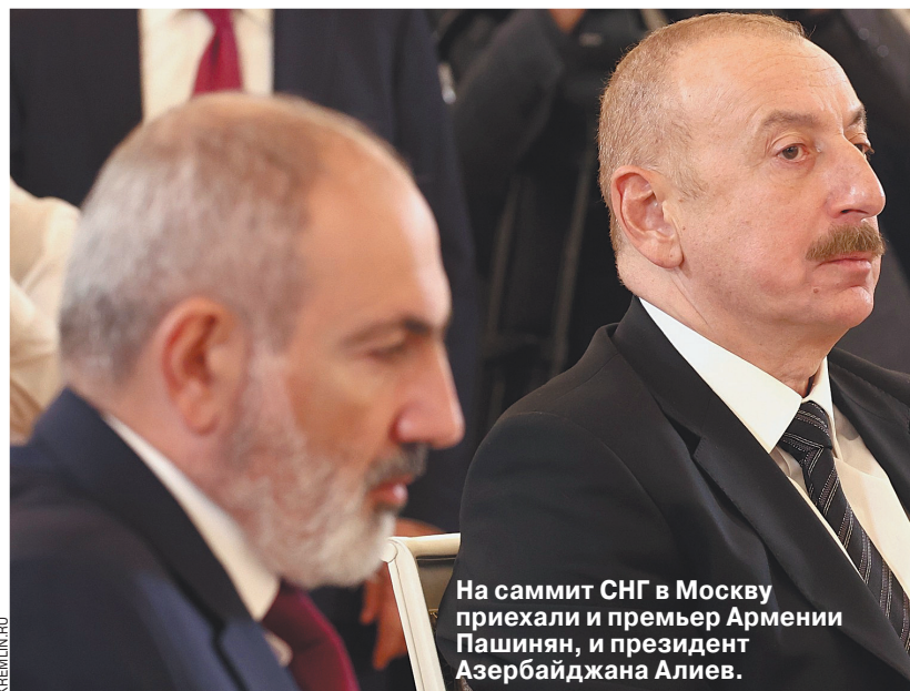
На саммит СНГ в Москву приехали и премьер Армении Пашинян, и президент Азербайджана Алиев.