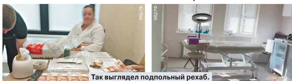
Так выглядел подпольный рехаб.

Столичный псевдорехаб, в котором медработники, не имея лицензии, лечили больных разными зависимостями, накрыли сотрудники ОЗБП КУВД по Юго-Востоному округу Москвы совместно с коллегами из регионального Управления ФСБ и Росгвардии. Цены на медслужбы были ничем не обоснованы. Как выяснил «МК», частная клиника на Смирновской улице, работающая с 2020 года, имела лицензию только на оказание скорой помощи на дому. Однако медработники занимались лечением нарко- и алкоголезависимых граждан в стационаре. Об этом стало известно весной 2024 года, когда родственники пациентов стали массово обращаться в полицию и прокуратуру с просьбой проверить законность деятельности организации. Близкие, кроме того, жаловались на баснословные расценки на услуги.