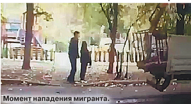
Момент нападения мигранта.

Педофила, похитившего 11-летнюю девочку со двора дома, чтобы удовлетворить свою похоть, разоблачили следователи Главного следственного управления СКР по Москве. В течение часа негодяй удерживал школьницу — спас ребенка звонок отца на мобильный телефон.