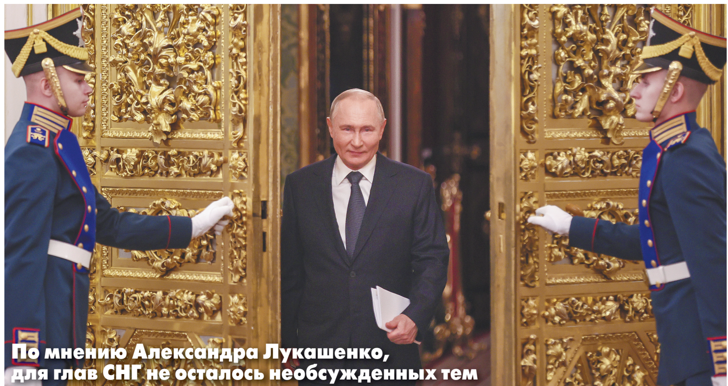
По мнению Александра Лукашенко, для глав СНГ не осталось необсужденных тем

Саммит СНГ состоялся на следующий день после совместного празднования 72-летия Владимира Путина, поэтому лидеры были немногословны. «Вчера обсудили все вопросы, я иду и думаю: о чем мы сегодня будем