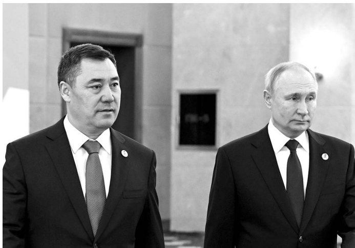
Главы России и Кыргызстана выступают за равные права на управление интернетом для всех стран.

Как отмечают главы государств, сфера применения IT-технологий давно имеет трансграничный характер. По этой причине национальные меры по обеспечению информационной безопасности должны быть до-