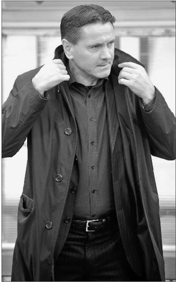
Вчера, Тула. «Арсенал» - «Спартак» НЧ - 3:2. Пока Дмитрий АЛЕНИЧЕВ соперничает с нальчикским «Спартак» в ФНЛ. Не исключено, что следующий сезон он начнет во главе «Спартак» московского.

Кто станет главным тренером «Спартак»? И сумеет ли этот человек вызволить клуб из жесточайшего кризиса? «СЭ» называет главных на сегодняшний день кандидатов и задачи, которые будут стоять перед новым наставником красно-белых.