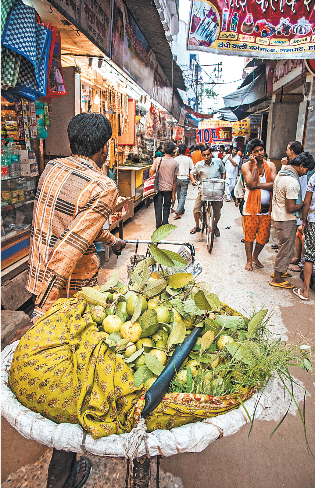
Индийские сельхозпроизводители готовы поставлять в Россию крупы, чай и специи.

Есть локальные игроки и на рынке электроники и бытовой техники. Россиянам уже знаком Micromax — эта небольшая по местным меркам компания, выпускающая смартфоны, уже пыталась несколько лет назад выйти на российский рынок. Среди других игроков отметим Intex — эта компания преуспевает как на рынке бытовой техники, так и гаджетов.