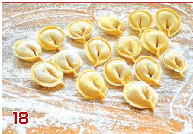
Смеси «Омега» для производства пельменей: качественно и эффективно!