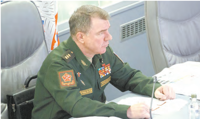
Командующий войсками ЗВО генерал-полковник Александр Журавлёв на брифинге

У причальной стенки Восточной Усть-Рогатки и Зимней пристани посетители форума смогут увидеть береговые ракетные комплексы «Бал» и «Бастيون», пусковую установку оперативно-тактического ракетного комплекса «Искандер», зенитно-ракетную систему С-400 «Триумф»,