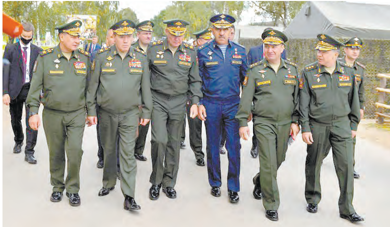
Начальник Генерального штаба ВС РФ и командующий войсками ЗВО с группой офицеров и генералов руководящего состава в Алабино накануне открытия военно-технического форума и АрМИ-2021