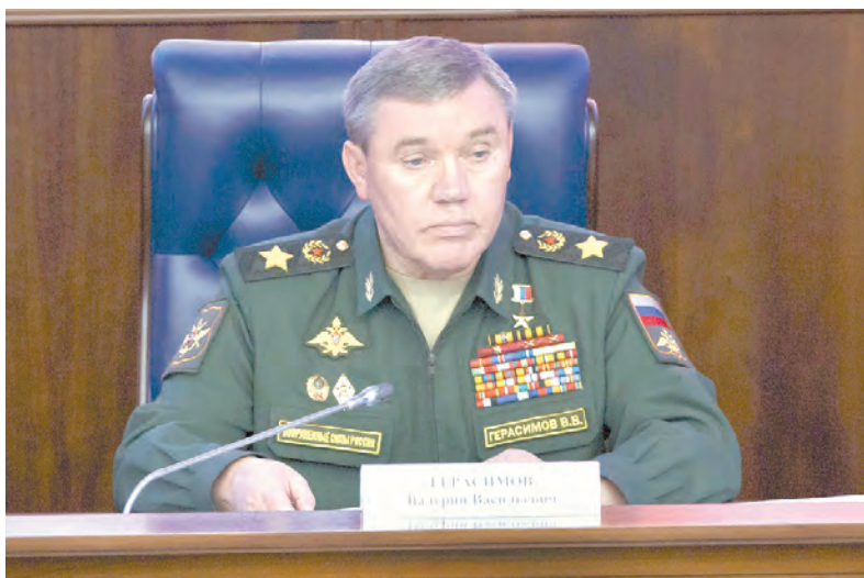
Начальник Генерального штаба ВС РФ генерал армии Валерий Герасимов на брифинге

С брифинга для иностранных военных атташе