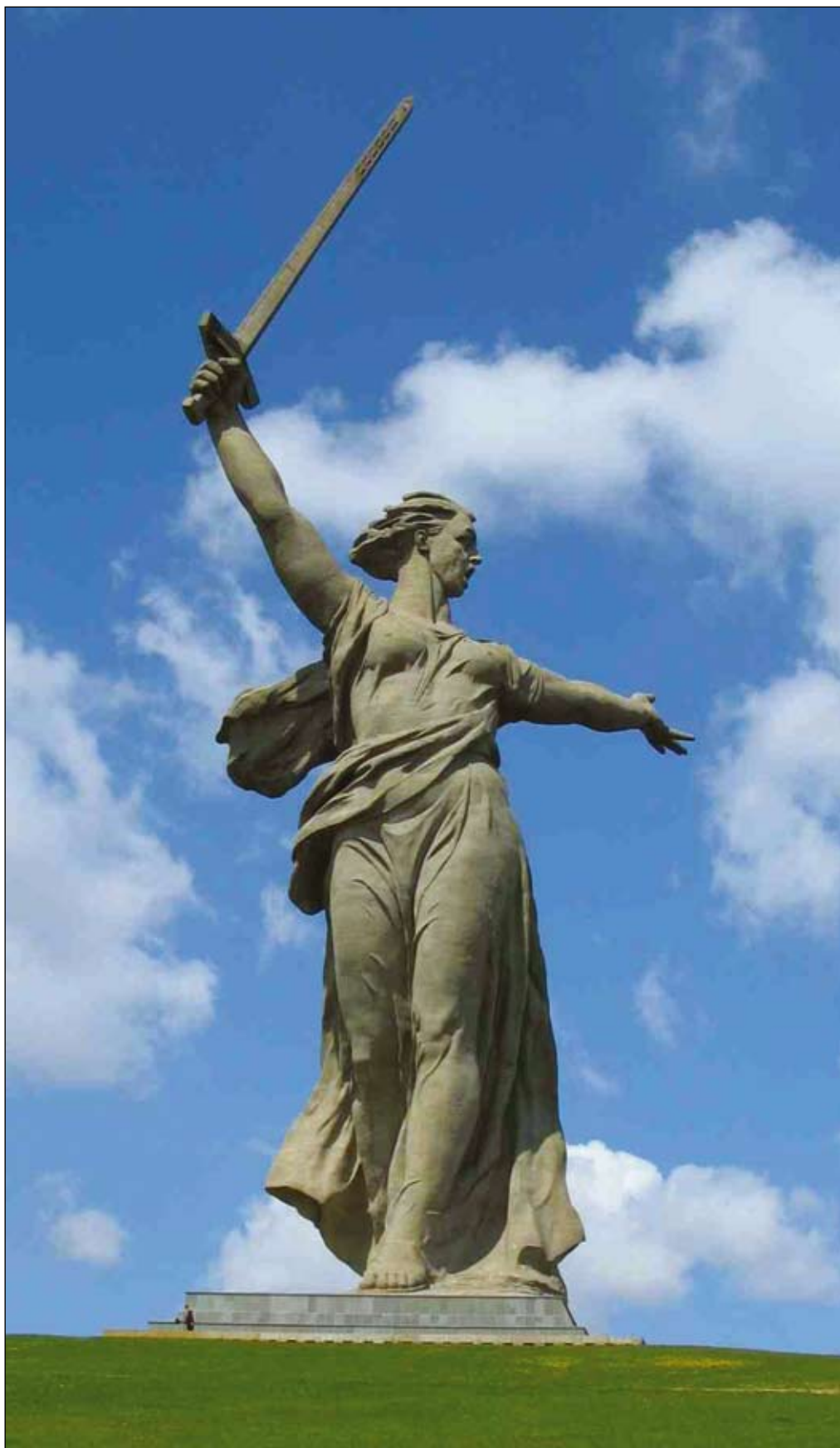
СКУЛЬПТУРА «РОДИНА-МАТЬ ЗОВЕТ!» НА МАМАЕВОМ КУРГАНЕ В ВОЛГОГРАДЕ.

Архитекторы Е. В. Вучетич, Н. В. Никитин. 1959—1967 годы