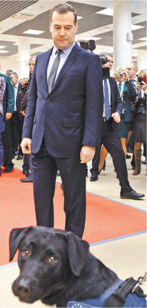
А в среду премьер побывал на Международной выставке «Таможенная служба-2014», открывшейся в столичном «Экспоцентре».

режая самые первые планы в рамках ЕАЭС. Для реализации российско-белорусского сотрудничества правительства двух стран согласовали проект бюджета на 2015 год. «Считаю важным, что в текущей непростой финансово-экономической ситуации мы сохранили его в прежнем объеме — почти 5 млрд рублей», — подчеркнул российский премьер. Глава белорусского правительства Михаил Мясникович, говоря об экономическом положении, на которое наложились еще и санкции против России, затронул возможность более широкого использования российского рубля во взаиморасчетах, создания национальных платежных систем и их объединения. «В будущем нам нужно выстраивать единые валютные позиции, — согласился Медведев. — Это и формирование открытых свопов в национальных валютах, и использование в расчетах российского рубля». Вспоминали в ходе Совмина давно обсуждаемые совместные проекты, например, предприятия на базе МАЗа и КА-МАЗа, по которым до сих пор стороны не могут прийти к соглашению. «Основной вопрос по таким проектам — это всегда деньги, — объяснил российский премьер причины затянувшихся переговоров. — Продавец хочет продать дороже, покупатель — купить по сбалансированной цене».