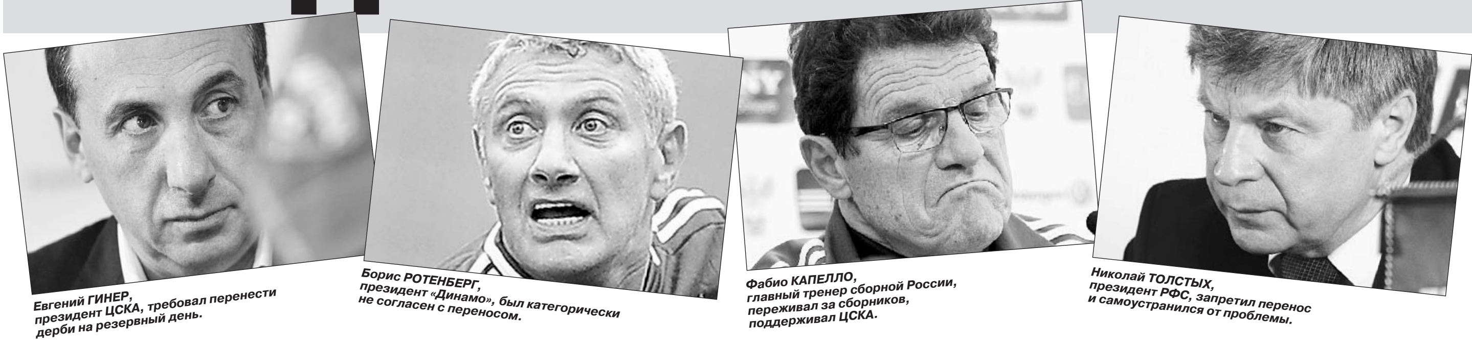
Евгений ГИНЕР, президент ЦСКА, требовал перенести дерби на резервный день.