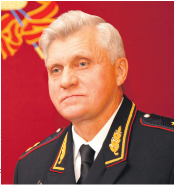
Владимир Винеvский занял пост главы кубанской полиции после ЧП в станице Кущевской.

Владимир Винеvский был назначен на свою должность в феврале 2011 года, сменив на этом посту уволенного после трагических событий в станице Кущевской прежнего главу краевого