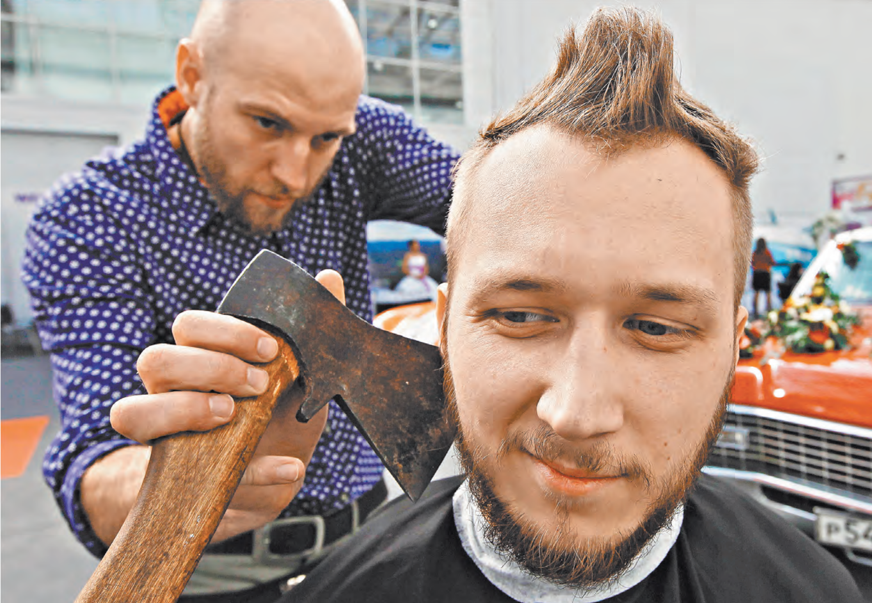
Если, например, парикмахер оказывает услуги физлицам как самозанятый, а не индивидуальный предприниматель, налог с доходов для него срезается в три раза — до 4% вместо 13%.

Пройдя простую и быструю регистрацию в мобильном приложении, самозанятые получают официальный статус, возможность работать без всякой отчетности и визитов в налого-