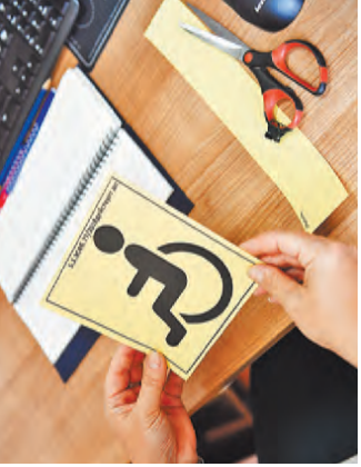
Знак «Инвалид» заменит запись в Федеральном реестре инвалидов об используемом транспорте.

До 1 января 2021 года инвалиды или их законные представители для получения права на бесплатную парковку должны подать заявление в Пенсионный фонд о внесении машины в этот реестр. Это можно сделать через портал госуслуг, а также