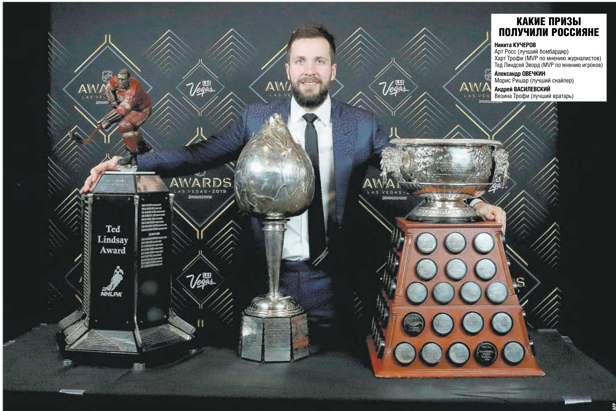
Вчера. Лас-Вегас. Никита КУЧЕРОВ с тремя наградами: «Тед Линдсей», «Харт Трофи» и «Арт Росс» (слева направо).

Вчера в Лас-Вегасе состоялась церемония вручения индивидуальных призов НХЛ. Россияне выиграли пять наград по итогам сезона: Александр Овечкин - лучший снайпер, Андрей Василевский - лучший вратарь, Никита Кучеров - лучший бомбардир, а также самый ценный хоккеист - как по версии журналистов, так и самих игроков.