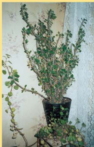
Салихов Айрат, 13 лет