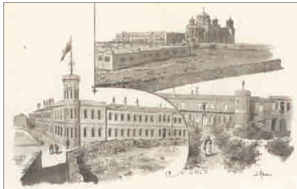
Святая земля в акварелях художника Алексея Даниловича Кившенко (1851–1895)

Московский журнал. История государства Российского. № 11 (251). Ноябрь 2011