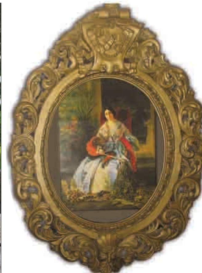
Рама для портрета