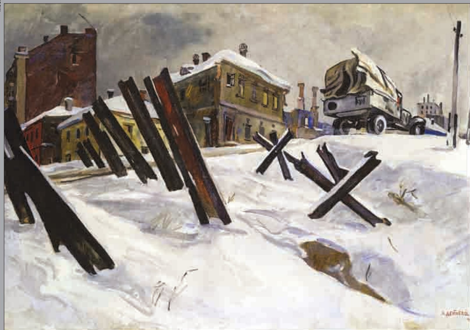
А. А. ДЕЙНЕКА. ОКРАИНА МОСКВЫ. НОЯБРЬ 1941 ГОДА. ХОЛСТ, МАСЛО. 1941 ГОД