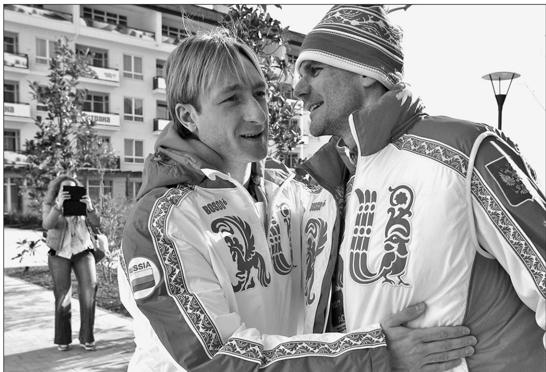
Вчера, Сочи. Прибрежная Олимпийская деревня. Евгений ПЛЮЩЕНКО (слева) и генеральный менеджер женской сборной России по хоккею Алексей ЯШИН.

В олимпийскую столицу Плющенко прибыл вечером в понедельник. Но понять, появится ли он на катке во вторник, не представлялось возможным на протяжении всего дня. Тренер олимпийского чемпиона Алексей Мишин за полчаса до первого занятия своего подопечного в Сочи, знавшего в расписании, о чем-то мирно беседовал на входе в тренировочный центр с агентом и хореографом фигуриста. К ним регулярно подходили западные журналисты - желали удачи и спрашивали о том, как дела у Евгения. Компания отвечала на все вопросы с задором и улыбками. Тем временем внутри арены толпы фотографов и журналистов томились в ожидании звезды. Но час переминовения с ноги на ногу так ни к чему и не привел - Плющенко на стадионе не появился. А вот Мишин на каток все же заглянул, посмотрел, как занимаются другие, в том числе один из главных фаворитов турнира в мужском одиночном катании японец Юдзуру Ханю. После чего маститый наставник не обделил вниманием и российскую прессу. - Для Жени и всей команды, которая с ним работает, выступление на Олимпиаде - большая честь и большая ответственность, - подчеркнул Мишин. - Еще большая ответственность падает на спортсмена, если он выступает в командном турнире. Первая медаль, которая разыгрывает-