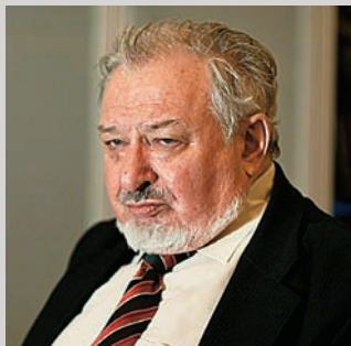
АНТОН УНИЦЫН/GRINBERG AGENCY