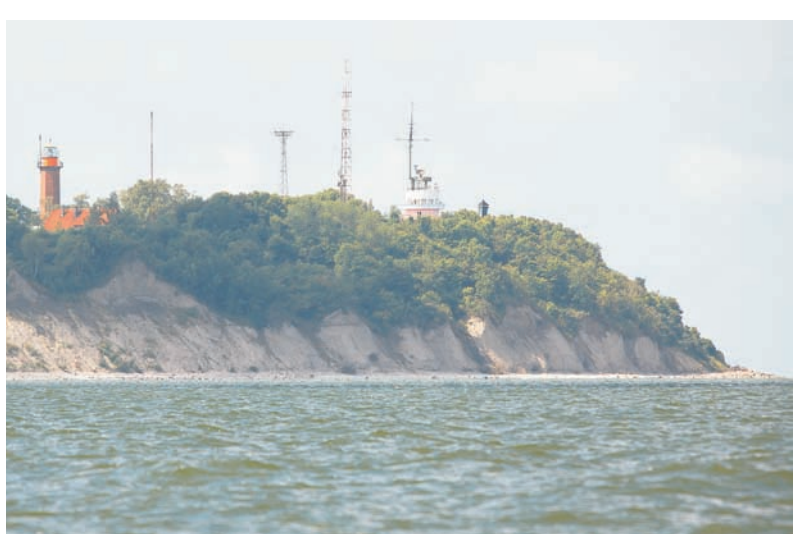
Маяк и пост наблюдения на мысе Таран.

Виктор МАКСИМЕНКО, фото автора и Н. Ягунова.