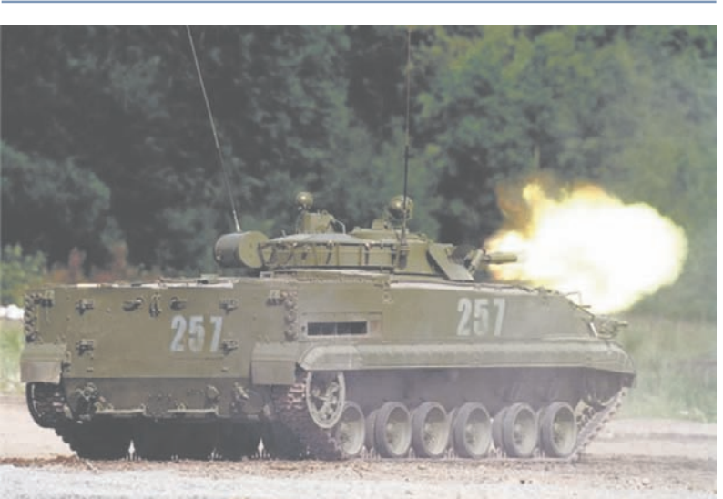
Точно в цель.

Юрий ДМИТРИЕВ, фото автора и сайта mil.ru.