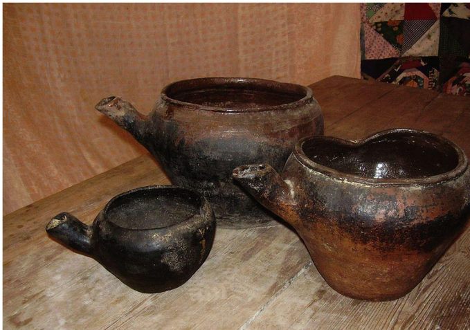
Посуда крестьянского дома