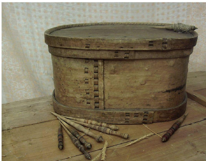
Лукошко и веретена