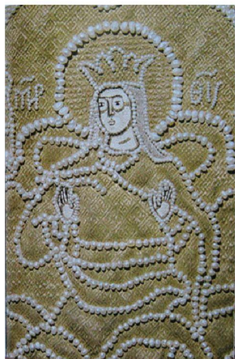
Элементы отделки саккоса патриарха Никона. 1655 г.