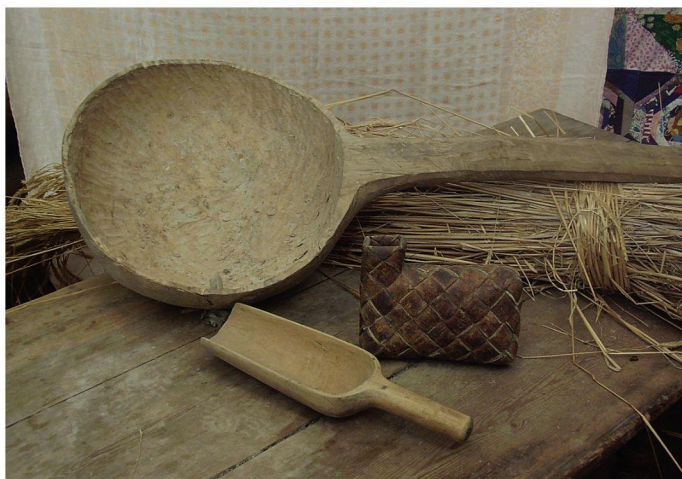
Деревянные ковш и совок, солонка из бересты