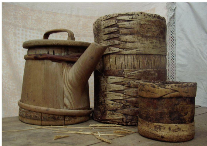
Бытовая утварь из бересты