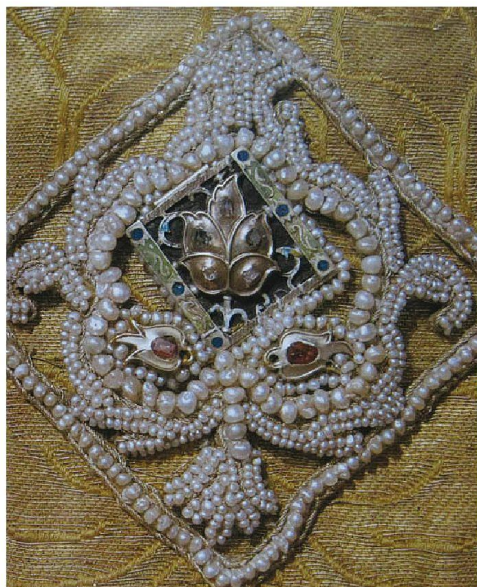
Элемент жемчужного шитья. XVII в.