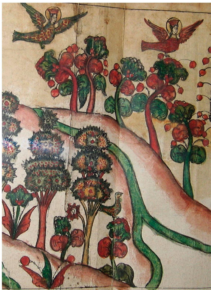
Фрагмент рукописи из собрания Архангельского музея изобразительных искусств. 1815 г.