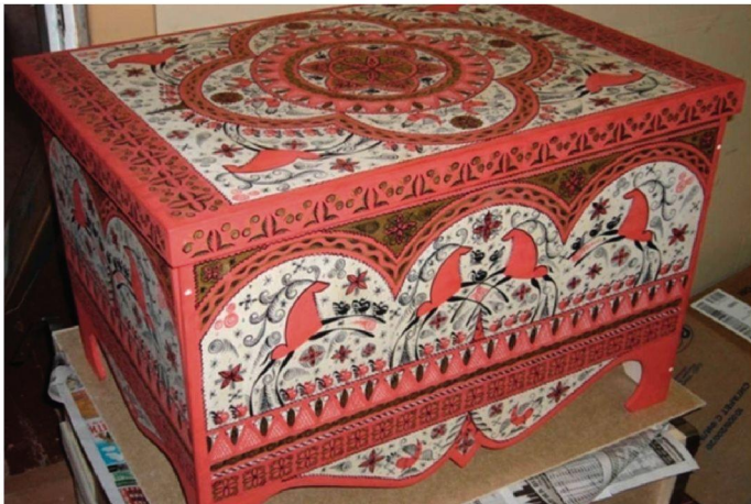
Сундук с Мезенской росписью