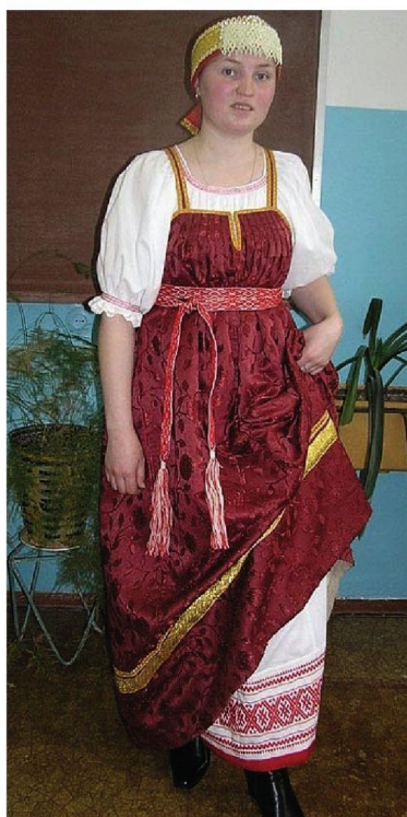
Народные костюмы, изготовленные студентами