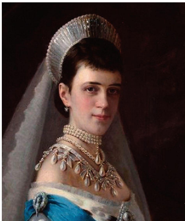
Императрица Мария Федоровна в жемчужном уборе. Худ. И.Н. Крамской, 1880 г.