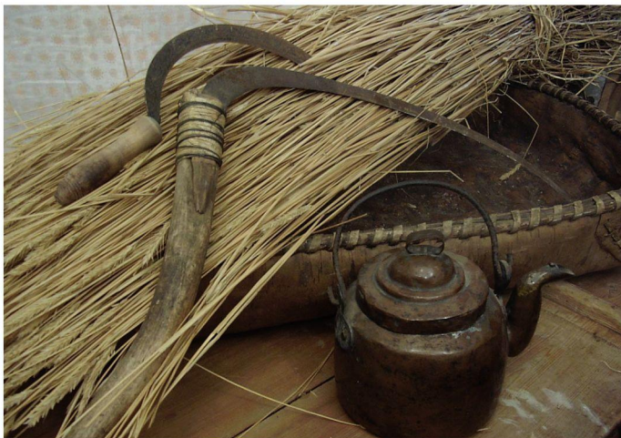
Серп, коса и чайник