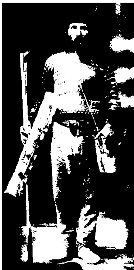
Фото жемчуголова (Историко- мемориальный музей М.В. Ломоносова, Архангельская обл.)