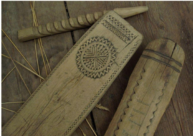
Резные рубели для глажения белья