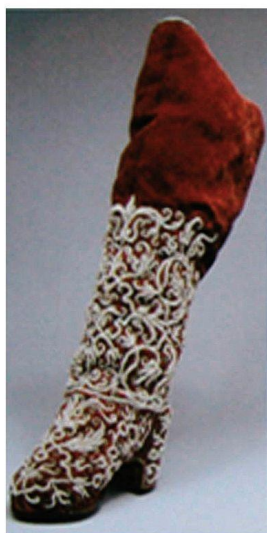
Сапожок. XVII в.