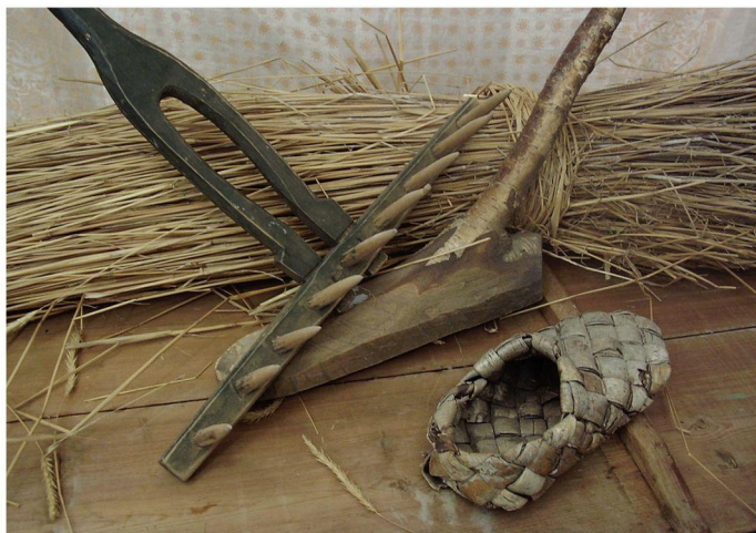
Грабли, мотыга и лапоть