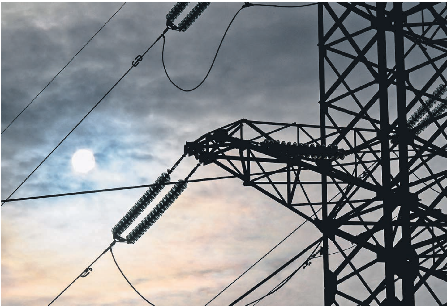
Энергетические связи между Россией и Финляндией становятся все тоньше

«Угрозы достаточности электроэнергии в Финляндии нет», — заявил финский оператор магистральных сетей Fingrid, уточнив, что из РФ в последнее время импортируется примерно 10% от общего потребления Финляндии. По словам оператора, нехватки поставок из России компенсируют импортом из Швеции и собственной выработкой. Комментариев относительно прекращения платежей за российскую электроэнергию с финской стороны вчера не последовало. Ожидается, что Финляндия полностью откажется от импорта электроэнергии из России в 2023 году. В апреле Fingrid сообщила, что ограничит пропускную способность интерконнек-