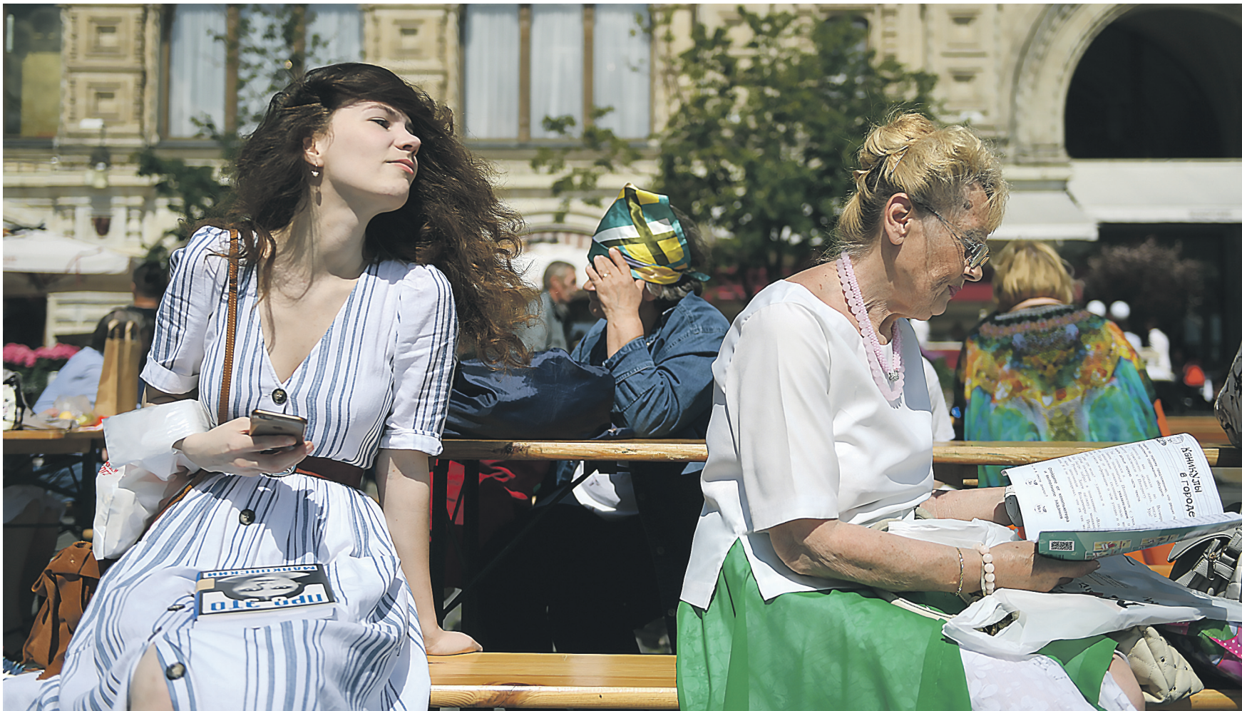
ВАЛЕРИЙ МЕЛЬНИКОВ / УРА.НОВОСТИ