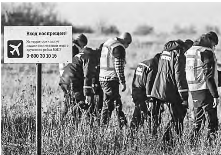
Сбор обломков малайзийского самолета начали и тут же прервали из-за обнаружения новых человеческих останков.

О том, как идет, пожалуй, самое непростое расследование в истории мировых авиакатастроф, корреспондент «РГ» беседует с генеральным директором Консультативно-аналитического