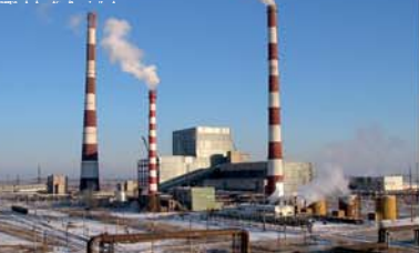
Нижневартовская ГРЭС – энергоблок № 2