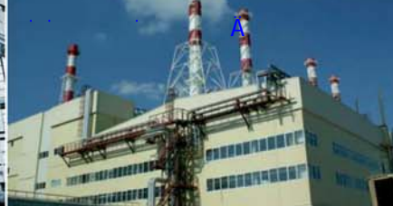
Реконструкция РТС «Строгино» с установкой ПГУ ТЭС