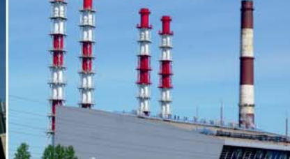
Реконструкция Первомайской Теплоэлектроцентрали (ТЭЦ-14 филиала «Невский» ОАО «ТГК-1»)

Миссия компании ЭМК-Инжиниринг: обеспечение комплексного инженерингового подхода в реализации ЕРС/ЕРСМ проектов по сооружению энергетических объектов в соответствии с современными стандартами качества в интересах партнёров и акционеров.