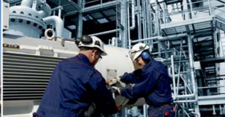
Нижневартовская ГРЭС – энергоблок № 2