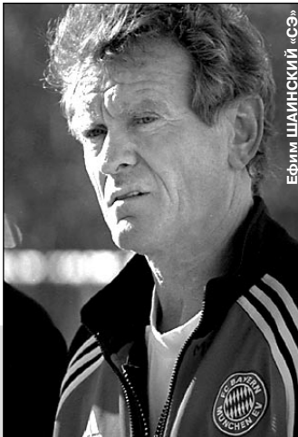
Евгений ДЗИЧКОВСКИЙ «СЭ»

6 октября 1975 года. Киев. Суперкубок Европы. Ответный матч. «Динамо» К — «Бавария» — 2:0. 40-я минута. Олег БЛОХИН открывает счет, забив в ворота Зеппа МАЙЕРА второй из трех голов в двух играх с мюнхенским суперклубом.