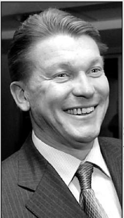
Александр Вилфё «СЭ»

Полностью интервью Зеппа Майера и Олега Блохина, а также другие материалы о финале Лиги чемпионов — стр. 2 - 4