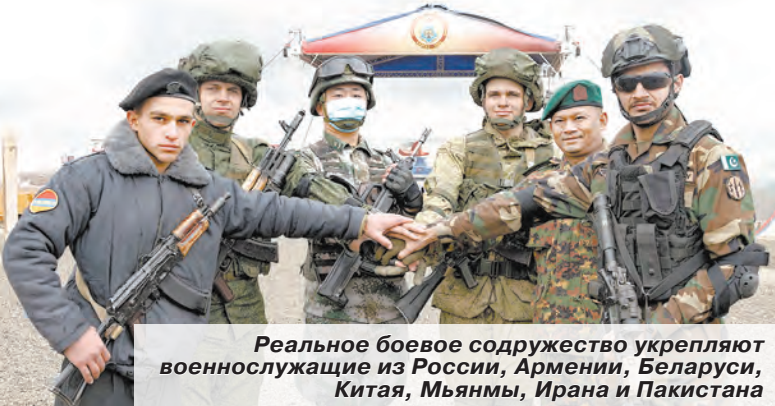
Реальное боевое содружество укрепляют военнотехнические из России, Армении, Беларуси, Китая, Мьянмы, Ирана и Пакистана

В одном из самых масштабных учений года – «Кавказ-2020», проводимом с участием представителей дружественных армий, задействовано шесть тысяч военнотехнических и 750 единиц вооружения, военной и специальной техники ЗВО. Для их качественной подготовки был проведён целый комплекс специальных учений по развёртыванию системы обеспечения в интересах группировок войск и сил на юго-западном стратегическом направлении.