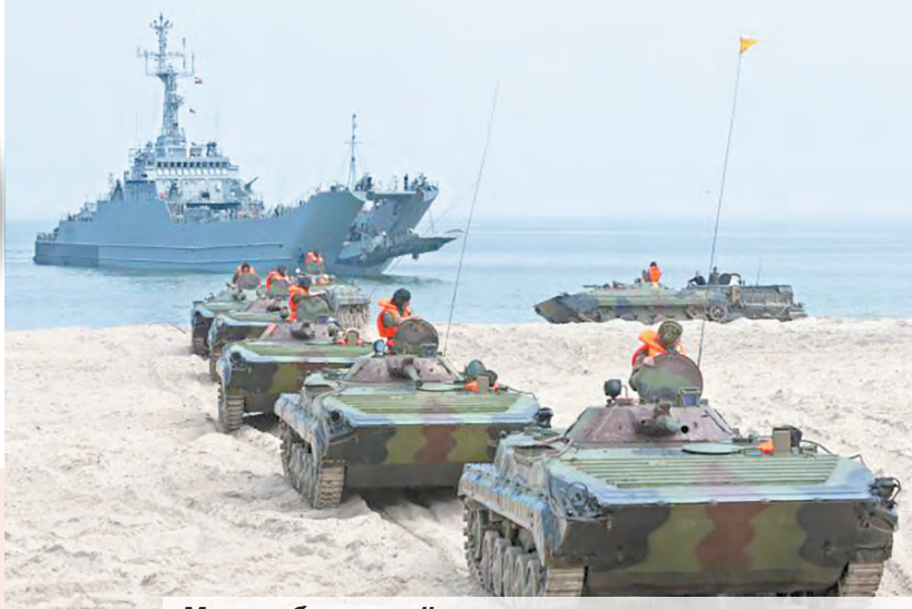
Масштабные манёвры проходят на земле, в воздухе и в акваториях Каспийского и Чёрного морей

В одном из самых масштабных учений года – «Кавказ-2020», проводимом с участием представителей дружественных армий, задействовано шесть тысяч военнотехнических и 750 единиц вооружения, военной и специальной техники ЗВО. Для их качественной подготовки был проведён целый комплекс специальных учений по развёртыванию системы обеспечения в интересах группировок войск и сил на юго-западном стратегическом направлении.