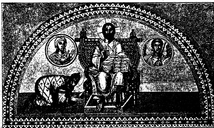
Мозаика Царегородской Софіи.

окружена турецкими владѣніями на самомъ Балканскомъ полуостровѣ. Россія необъединенная вполнѣ, еще неокончательно страшнувшаяся съ себя иго татарское, находившаяся подъ властью Василия Темнаго, конечно, не могла спасти Византію отъ гибели, и та молила западъ о помощи. Но тамъ больше думали не о томъ, что нужно дать грекамъ, а о томъ, что нужно взять съ нихъ, и рѣшили взять у нихъ, какъ плату за по-