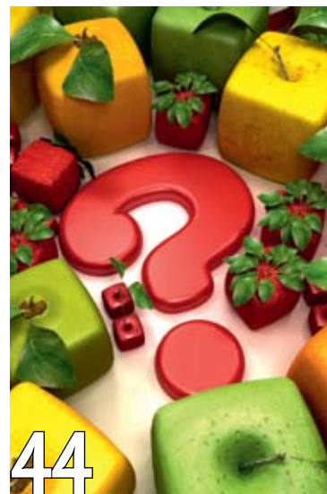
ГМО: мифы и реальность