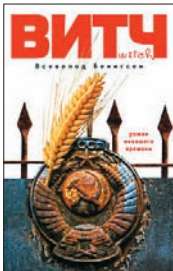
Бенигсен Вс. ВИТЧ М.: АСТ, 2011. — 384 с.