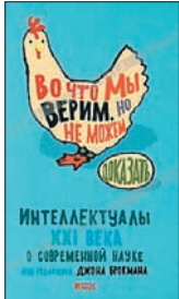
Во что мы верим, но не можем доказать: Интеллектуалы XXI века о современной науке. Под ред. Дж.Брокмана / Пер.с англ. А.Стативки. М.: Альпина non-фикшн, 2011. — 336 с.

7 Совершенно не секрет, что нынешние ученые — то же, что древние шаманы. Они могут произносить глубокомысленные заклинания, сами мало понимая, что делают. Но, в отличие от других, члены проекта Edge честно признаются в своем незнании законов природы. И все-таки они верят в инопланетян, антигравитацию, холодную плазму и прочую современную магию.