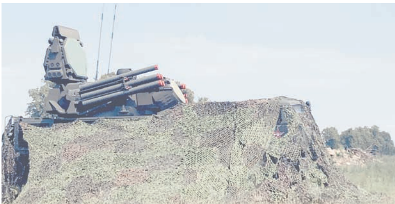
Зенитные комплексы на позиции.