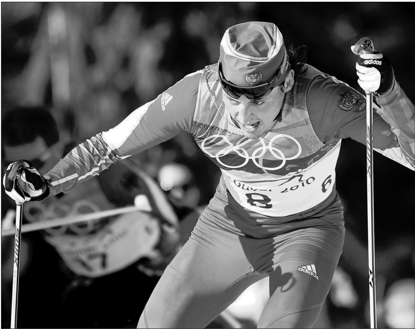
Суббота. Уистлер. Герой дуатлона Александр ЛЕГКОВ.