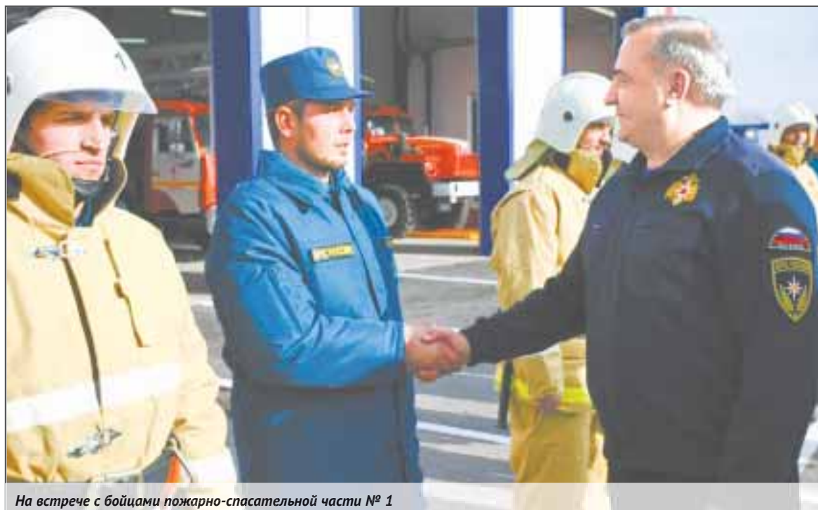
На встрече с бойцами пожарно-спасательной части № 1

«По решению Президента Российской Федерации мы завершаем подготовку целого пакета до-