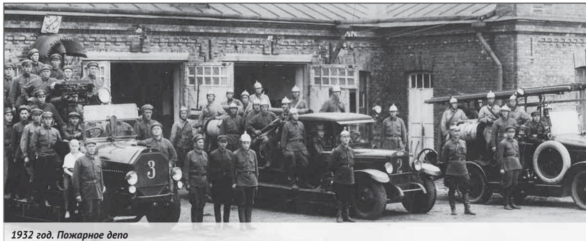
1932 год. Пожарное депо

Алена Миронова, пресс-служба ГУ МЧС России по Тамбовской области